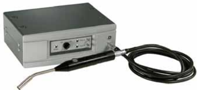
Gegenstrommesskopf-Modul AP57 mit Handmesskopf